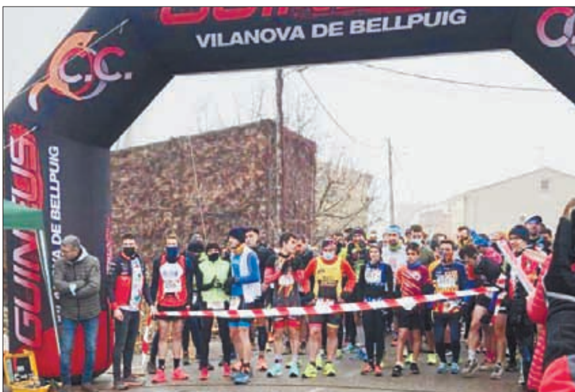
La prueba reunió a participantes de todas las edades