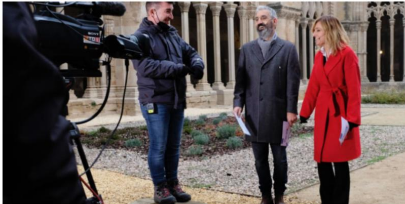
Turó S.V./ La Seu Vella va ser el plató de TV3

Els municipis de la demarcació de Ponent s'han bolcat, un any més, amb La Marató de TV3 i Catalunya Ràdio organitzant desenes d'activitats arreu del territori per recaptar diners i per sensibilitzar la ciutadania sobre les malalties mentals. Algunes de les propostes més repetides van ser caminades, concerts, tallers i bingos. Es van celebrar actes en capitals de comarca com Balaguer, Tàrraga i Mollerussa, on van celebrar matinals d'activitats, mentre que Cervera va optar per un concert de Nadal i les Borges Blanques, un bingo solidari. Altres activitats esportives que es van celebrar diumenge a la ciutat de Lleida, a banda de la pujada a la Seu Vella, van ser un 'escape room' sota l'aigua, organitzat pel Club Inef Lleida, i una activitat d'escalada al rocòdrom del Pavelló Juanjo Garra.