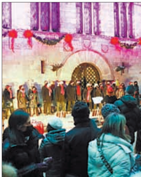
Cantada de gòspel a la Plaça Paeria

D'altra banda, el Saló Víctor Siurana de la Universitat de Lleida (UdL) va tornar a ser ahir diumenge la seu a Lleida de recepció de trucades per La Marató, des de les 2 del migdia fins les 8 del vespre, després del parèntesi de l'any passat a causa de la situació sanitària.