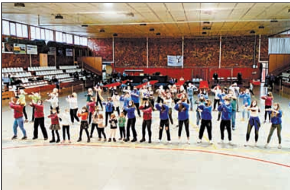
A Torres de Segre es va fer una Flasmob entre d'altres activitats