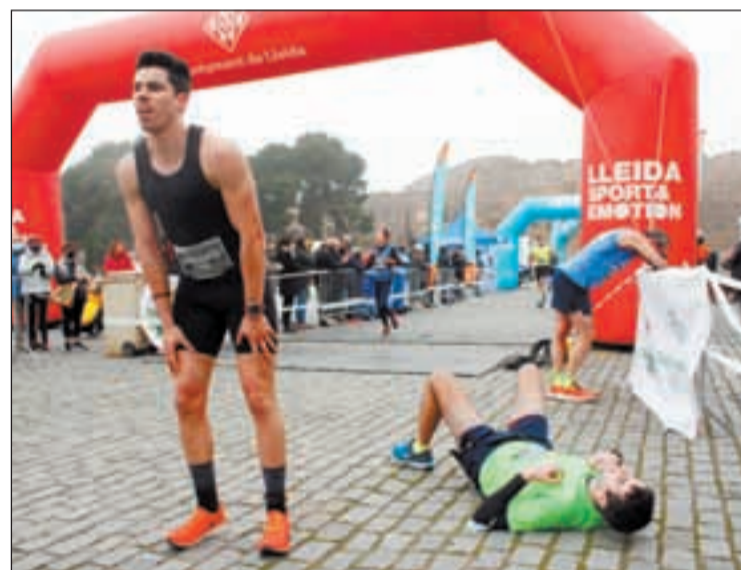
La dureza de la prueba podía comprobarse en la meta

Los premios que se han entregado tenían diferentes motivos, muchos de ellos fueron establecimientos de Lleida que quisieron estar presentes en los eventos deportivos que se celebran en la ciudad. Además, todos aquellos que no entraron en la categoría de premios, podían participar en los diferentes sorteos que la organización había preparado.