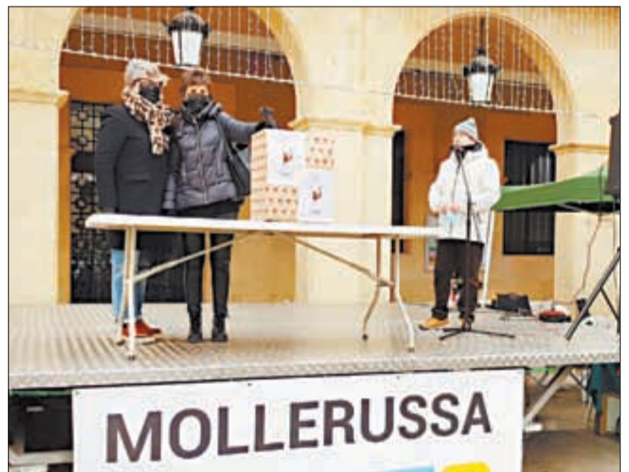
La capital del Pla també es va sumar a la jornada solidària

Lleida ANNA BERGA (ACN)/ REDACCIÓ Els municipis de la demarcació de Ponent s'han bolcat, un any més, amb La Marató de TV3 i Catalunya Ràdio organitzant desenes d'activitats arreu del territori per recaptar diners i per sensibilitzar la ciutadania sobre les malalties mentals. Algunes de les propostes més repetides van ser caminades, concerts, tallers i bingos. Es van celebrar actes en capitals de comarca com Balaguer, Tàrraga i Mollerussa, on van celebrar matinals d'activitats, mentre que Cervera va optar per un concert de Nadal i les Borges Blanques, un bingo solidari. Altres activitats esportives que es van celebrar diumenge a la ciutat de Lleida, a banda de la pujada a la Seu Vella, van ser un 'escape room' sota l'aigua, organitzat pel Club Inef Llei-