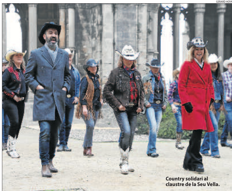
Country solidari al claustre de la Seu Vella.