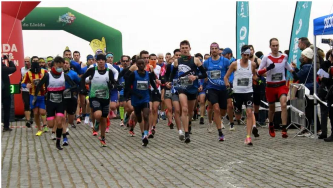
Pla obert de la sortida de la cursa de la 40a Pujada a la Seu Vella de Lleida que col·labora amb La Marató, el 19 de desembre de 2021. (Horitzontal)

ACN Lleida.-Els municipis de la demarcació de Ponent s'han bolcat, un any més, amb La Marató de TV3 i Catalunya Ràdio organitzant desenes d'activitats arreu del territori per recaptar diners i per sensibilitzar la ciutadania sobre les malalties mentals. Algunes de les propostes més repetides han estat caminades, concerts, tallers i bingos. Així, un dels actes que han aplegat més participants a Lleida ha estat la 40a Pujada a la Seu Vella que destina a La Marató part dels diners de la inscripció dels més de 600 atletes participants. Altres capitals de comarca com Balaguer, Tàrrrega i Mollerussa han celebrat matinals d'activitats, mentre que Cervera organitza un concert de Nadal i les Borges Blanques, un bingo solidari.