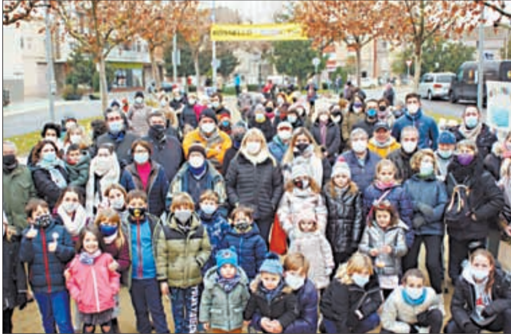
Prop de 1.0000 persones van participar a les activitats de Rosselló