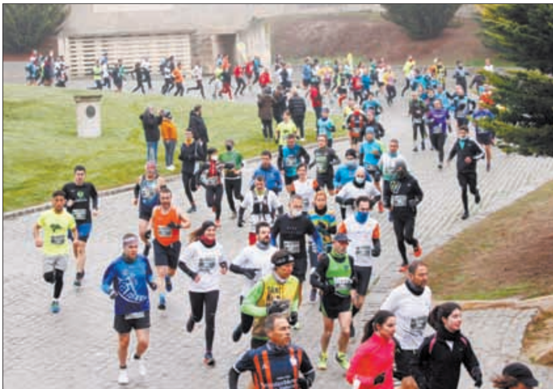
La Seu Vella volvió a llenarse de atletas