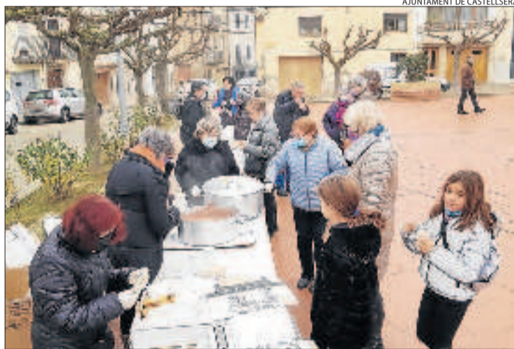
A Castellserà va tenir lloc una xocolatada popular.