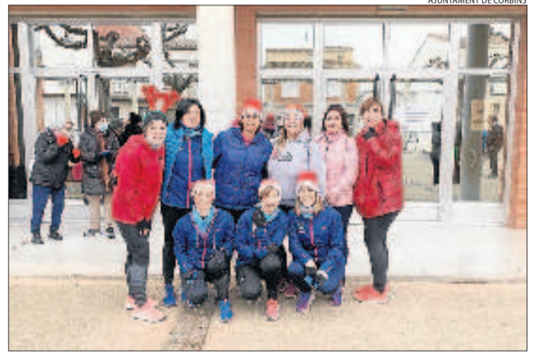
Un centenar de persones va participar en la caminada de Corbins.