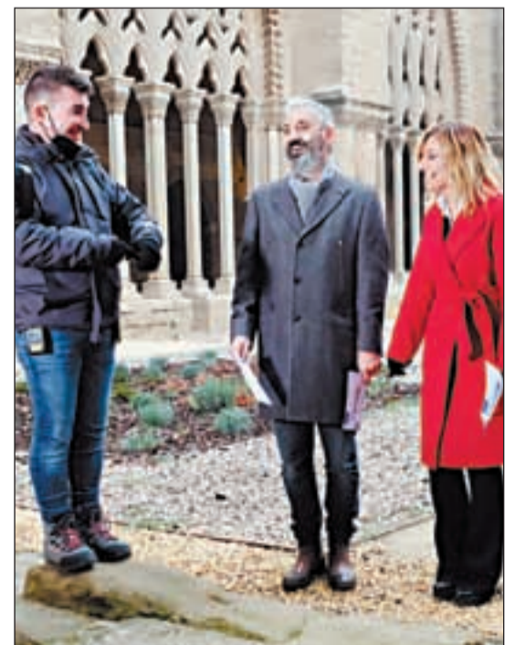
La Seu Vella va ser el plató de TV3