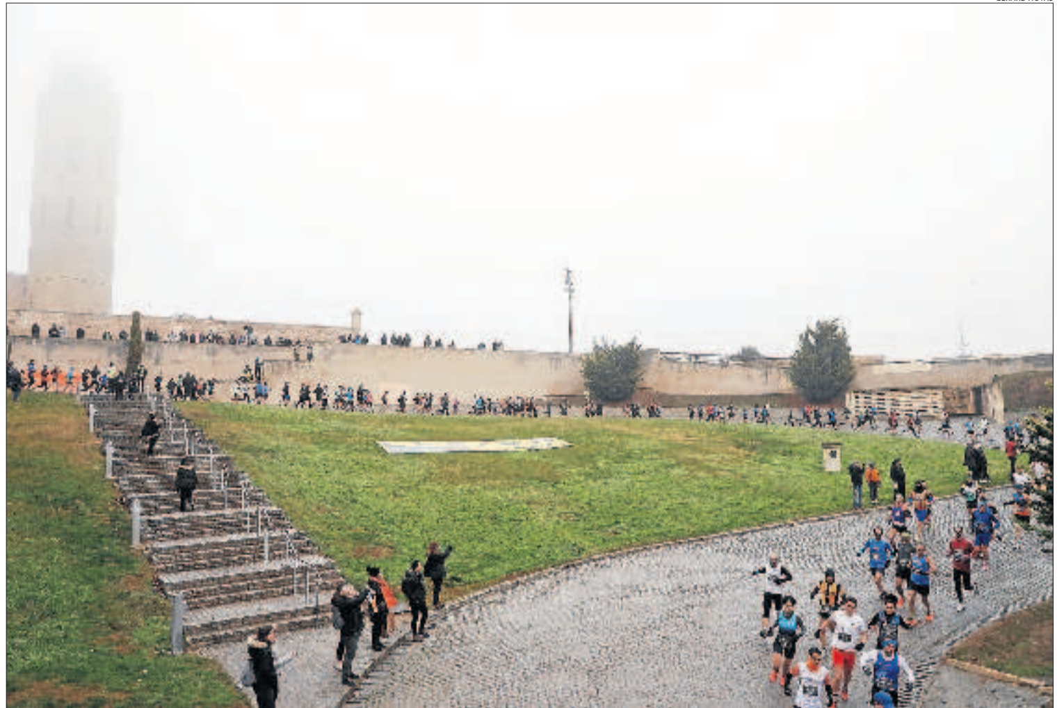
La Pujada a la Seu es va celebrar de nou després de l'aturada de l'any passat per la pandèmia, amb 400 inscrits a la cursa i 200 a la caminada.