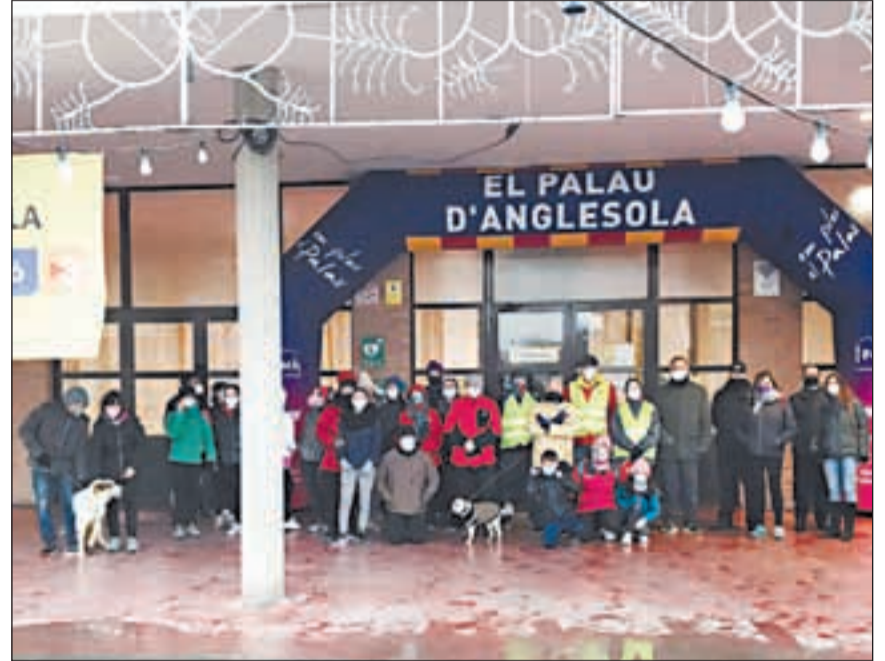
Al Palau d'Anglesola es va fer una caminada al matí