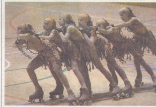
Patinatge de primera línia. El pavelló Onze de Setembre va reunir ahir els millors especialistes del món en la primera gala de patinatge del Llista Blava. O. MIRÓN

Los mejores goles no son los que te cuentan, son los que vives.