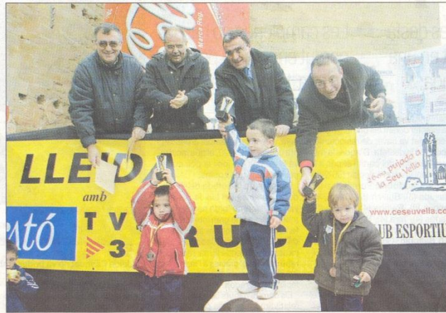
Els petits van fer mèrits per després pujar al podi i aixecar, amb algun ajut, els seus trofeus

Els petits lleidatans van disputar el seguit de curses per categories a la falda de l'emblemàtic monument de la ciutat de Lleida però van haver de patir de valent per superar el desnivell. Tothom està citat, doncs, per l'edició de l'any vinent, que de ben segur tornarà a ser un èxit en tots els aspectes.