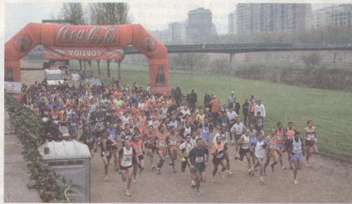
Els atletes van haver de superar 11.800 metres des de la canalització. AMADO FORROLLA

A la meta, els esperava a tots els participants, entre els quals també hi havia uns 300 nens, un caldo reparador per a una jornada en què el fred no va perdonar. És que coincidint amb la tradicional Pujada a la Seu Vella, que enguany ha arribat a la 26ª edició, es va fer també ahir una jornada de promoció dels productes ecològics de les terres de Lleida.