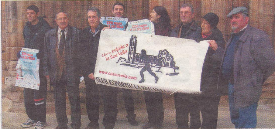
Foto de família dels organitzadors, amb representants de patrocinadors i institucions.