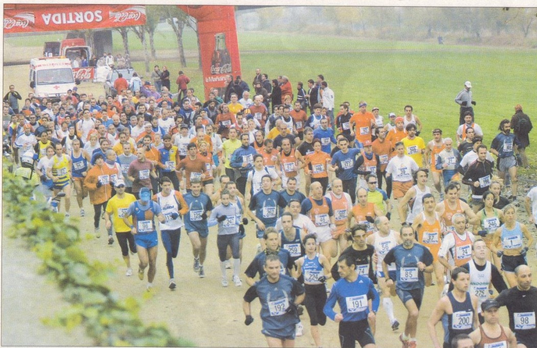
Momento de la salida en la canalización del río en Cappont. Los atletas tenían por delante un duro recorrido de 11.800 metros