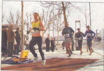
La dura ascensión final comenzaba en este punto