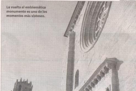
La vuelta al emblemático monumento es uno de los momentos más vistosos.