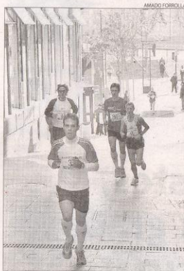
Las primeras rampas hicieron sufrir mucho.