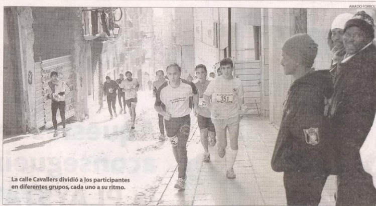
La calle Cavallers dividió a los participantes en diferentes grupos, cada uno a su ritmo.