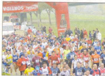
La Pujada sigue siendo una de las carreras de referencia

La Pujada a la Seu Vella calienta motores una temporada más. La tradicional prueba, una de las más prestigiosas del calendario catalán, vivirá su vigésimo séptima edición el próximo día 16 de diciembre y lo hará con algunas novedades pero con el mismo espíritu del primer día. La carrera reducirá su recorrido hasta los 10 kilómetros -en pasadas ediciones alcanzaba los 11,8- debido a las obras que se realizan en las