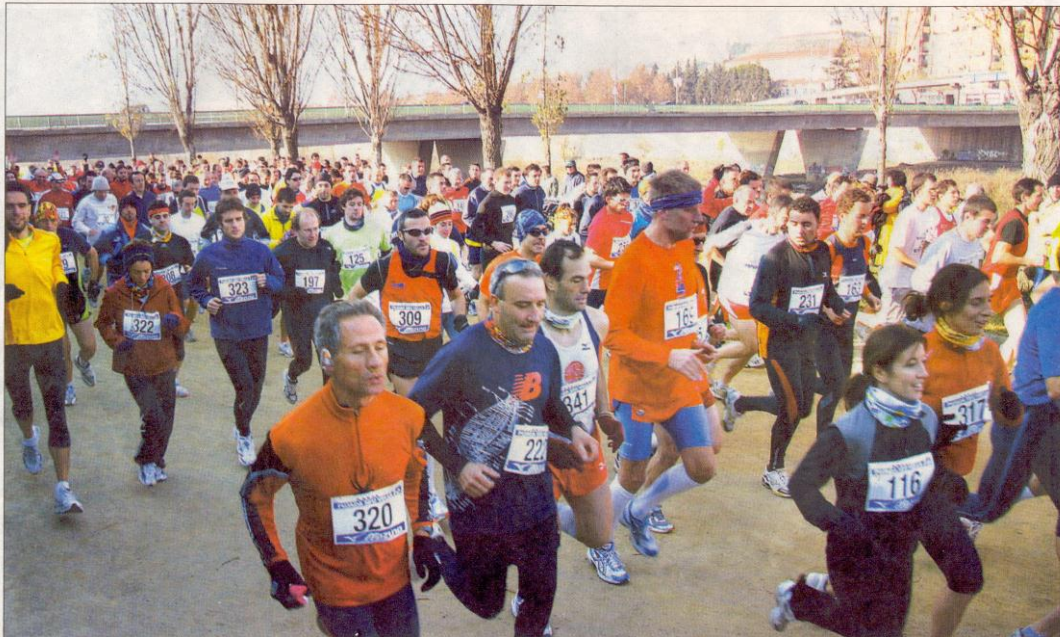
La carrera reunió a más de 350 atletas, que partieron de la Canalización para llegar a la Seu después de correr 9.800 metros