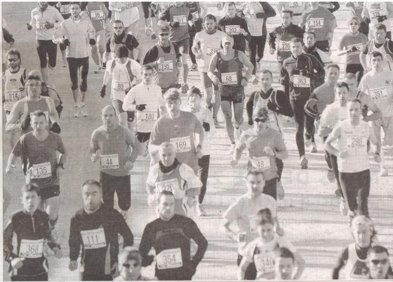
La mayor parte de los participantes iban al mismo ritmo en la canalización del Segre, la selección llegó con las primeras rampas en el tramo final.

Una vez acabado el recorrido los atletas pudieron combatir el frío, como lo habían hecho los que los esperaban en la línea de meta, con un vaso de caldo bien caliente. Aparte de los tres primeros, también tuvo premio la última clasificada que recibió un regalo de la Federació de Colles de l'Aplec como reconocimiento a su esfuerzo.